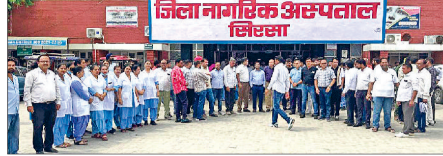
सिरसा। जिला नागरिक अस्पताल में जियोफेंसिंग आधारित उपस्थिति प्रणाली का विरोध करते कर्मचारी।

हरियाणा सिविल मेडिकल सर्विसेज एसोसिएशन, डेंटल एसोसिएशन, फार्मसी अधिकारी संघ सहित अन्य कर्मचारी संघ जुटे