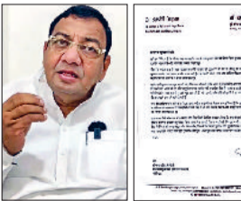
फतेहाबाद। जिला पुस्तकालय को लेकर आप प्रदेशाध्यक्ष द्वारा लिखा गया पत्र।