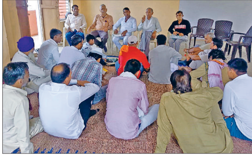
फतेहाबाद। ग्रामीण सफाई कर्मचारियों की बैठक को संबोधित करते कर्मचारी नेता।

आज तक लागू नहीं की गई। प्रदेश के मजदूरों के लिए 2015 से अब न्यूनतम वेतन रिवाइज नहीं हुए हैं, जबकि हर पांच सालों में न्यूनतम वेतन रिवाइज करना होता है। 2015 में हरियाणा व दिल्ली के न्यूनतम वेतन एक समान होते थे, दिल्ली के न्यूनतम वेतन 2020 में रिवाइज हो चुके हैं, लेकिन हरियाणा में नहीं, जिससे हरियाणा सरकार का न्यूनतम वेतन 6-7 हजार पीछे हो गया है। यह हरियाणा के मजदूरों के साथ भारी