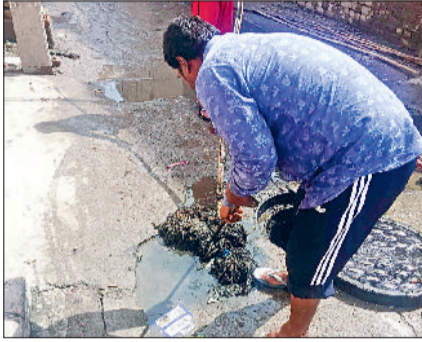
फतेहाबाद। ठाकर बस्ती में सीवरेज की सफाई करते कर्मचारी।