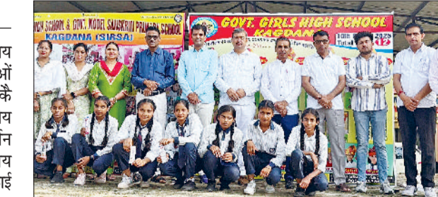
सिरसा। सम्मानित खिलाड़ी स्कूल प्राचार्य के साथ।