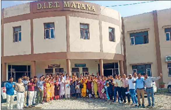
फतेहाबाद। डाइट मताना में आयोजित ट्रेनिंग में भाग लेते मेटर्स।

राज्य शैक्षिक अनुसंधान और प्रशिक्षण परिषद (एससीईआरटी) हरियाणा के निर्देशन में जिले के सभी मेटर्स के लिए पांच दिवसीय ट्रेनिंग का आयोजन किया गया। इफैक्टिव क्लासरूम ऑब्जर्वेशन विषय पर आयोजित यह ट्रेनिंग डाइट मताना में जिलेभर से 72 मेटर्स ने भाग लिया। 28 जुलाई से शुरू हुई इस ट्रेनिंग के पहले दो दिवस ऑनलाइन व अंतिम तीन दिवस ऑफलाइन प्रशिक्षण प्रदान किया