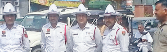
फतेहाबाद। बीघड़ चौक पर तैनात ट्रेफिक पुलिस कर्मचारी।

साइबर थाना फतेहाबाद पुलिस की टीम ने एक सराहनीय कार्य करते हुए गुमशुदा मोबाइल फोन उनके असली मालिकों को लौटाए, जिससे चेहरे पर मुस्कान लौट आई। सोमवार को पुलिस अधीक्षक कार्यालय परिसर में आयोजित एक विशेष समारोह में 11 स्मार्टफोन, जिनकी अनुमानित कीमत लगभग 8 लाख है, उनके वास्तविक मालिकों को सौंपे गए।