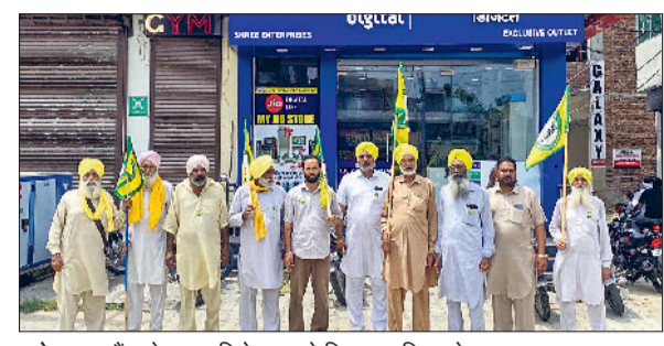
फतेहाबाद। बैंक के बाहर विरोध जताते किसान यूनियन के सदस्य।