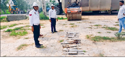
फतेहाबाद। जब्त किए गए साइलेंसर नष्ट करते ट्रैफिक पुलिस कर्मचारी।